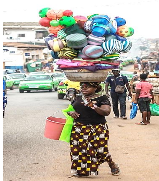
Figure 3 et 4 : Un commerçant de motocyclettes et une commerçante ambulante à Daloa.

Le désir de réalisation chez les Dioula, boosté par la culture, fait d'eux, des hommes présents au cœur de tous types d'activités économique. On assiste par conséquent à une redéfinition du Dioula. Selon un opérateur économique Malinké : « le dioula c'est le têtu, le combatif, le chercheur ; le dioula quitte chez lui pour aller ailleurs. Il fait tout pour gagner de l'argent ». Daloa est une ville qui offre une large possibilité d'exercer plusieurs types de commerce et aussi plusieurs activités économiques. Les Dioula, étant opportunistes, y trouvent une belle issue.