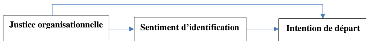
Figure N° 1 : Modèle de recherche