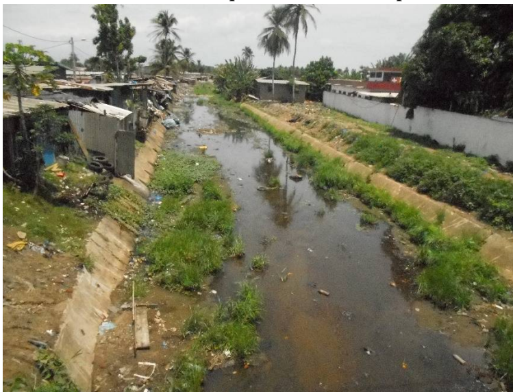
Photo n°3 : habitations de fortune au quartier Oddos ne respectant aucune servitude

lieu de forte concentration populations. Ils sont soumis au non-respect des règles urbanistiques en ce qui concerne l'occupation du domaine public. Parfois dans ces lotissements, selon l'ancienneté les premiers occupants s'arrogent des droits de propriétés sur l'espace en y installant des occupants sans l'accord préalable de la mairie qui ne réagit pas par la suite. Conséquences de ces installations, une occupation anarchique de l'espace comme nous le montre la photo 3.