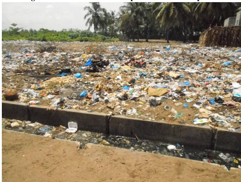
Photo 2 : Ouvrage d'assainissement obstrué par des déchets au petit marché

Avec une topographie particulièrement plane et face au manque d'ouvrages d'assainissement, les populations se connectent directement dans les caniveaux qui se trouvent souvent bouchés par toutes sortes de déchets (photo 2).