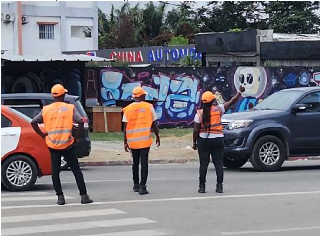
Photo : aides-régulateurs organisant la circulation au rond-point Ancien Camp à Cocody

Un autre point de tension relevé est l'initiative prise par l'AMUGA, dès 2020, de déployer des équipes « d'aides-régulateurs » sur certains carrefours d'Abidjan pour fluidifier la circulation aux heures de pointe. Ces agents ont été vus notamment sur la voie express de N'Dotré, à Cocody et à Yopougon, tentant d'ordonner le stationnement des gbakas et de faire respecter la priorité aux feux, comme en témoigne ce cliché pris sur la voie Y4 à Cocody.