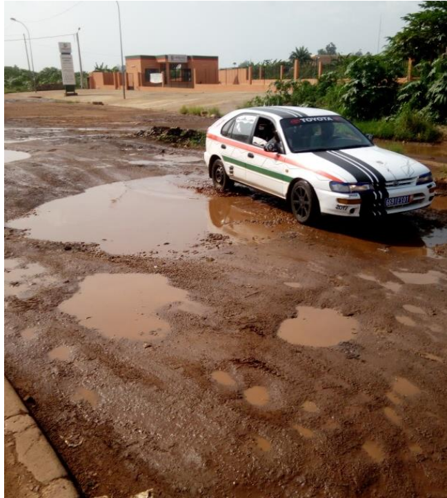
Photo 4 : Dégradation avancée de la voirie au quartier Dioulakro en 2023