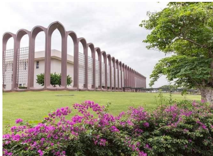
Photo 3 : L'Institut National Polytechnique Houphouët Boigny en 2023

Le mode de vie intelligent fait allusion à la disponibilité d'infrastructures culturelles pour l'épanouissement des populations, de favorables conditions de santé, de sécurité individuelle, de logement décent, des infrastructures éducatives adéquates et adaptées aux normes pouvant contribuer à un système éducatif performant, des valeurs touristiques pouvant contribuer à l'attractivité touristique et au bien-être économique des populations. L'observation de terrain a permis de découvrir que Yamoussoukro est une des rares villes du pays à disposer encore d'un certain nombre d'infrastructures pouvant exprimer un mode de vie intelligent. La photo 3 montre les tendances d'un mode de vie intelligent.