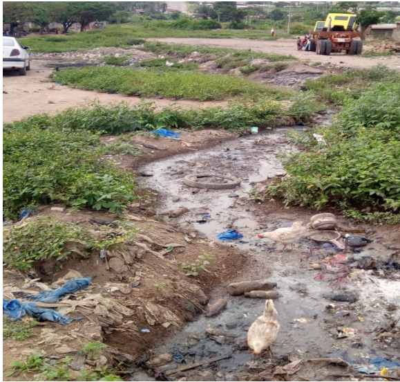
Photo 6 : Écoulement sauvage d'eau usée dans le quartier Dioulakro